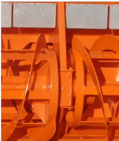
Überlastkupplung SF4 + SF5 • mit Reibkupplung